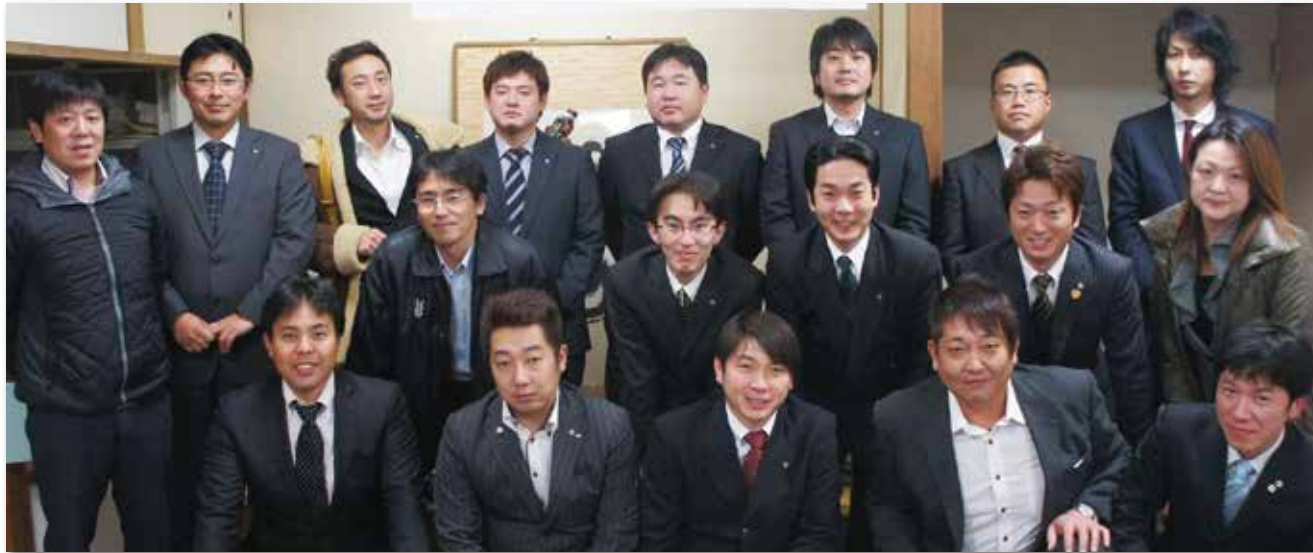
掲載 12月定例会及び通常総会

皆様におかれましては、つつがなく新しい年をお迎えのこととお慶び申し上げます。おかげさまで平成25年度宮若商工会議所青年部の事業として、12月の宮若冬ホタテクラリー大会に始まり、12月の宮若冬ホタテイルミネーション祭りまで約3分の2の事業を無事に行う事ができました。これも日頃から我々青年部に対する皆様のご理解とご協力のおかげで成功出来たと思っております。私個人としては、会長という立場で1番印象に残るのは9月に日本商工会議所青年部の主催で行われた『震災復興フォーラムin岩手』で訪れた宮城県気仙沼市での地元青年部の方々と交流が印象に残っています。 今までなかなか自ら訪れる事の出来なかつた被災地で実際に目にした光景、実際に聞いた震災時の様子は自分が想像した以上のものでした。平成23年におこった東日本大震災から3年近くなった現在でも復興と呼ぶには程遠い現状がそこにはありました。そんな中、元通りの地元を取り戻そうと地域の先頭に立って行動している青年部のメンバーに復興で何が必要ですか？と聞いた時に「何より震災の事を忘れないで下さい。」と言う答えでした。我々は同じ青年経済人として地元を愛するメンバーとして彼らの行動と発言に敬意を